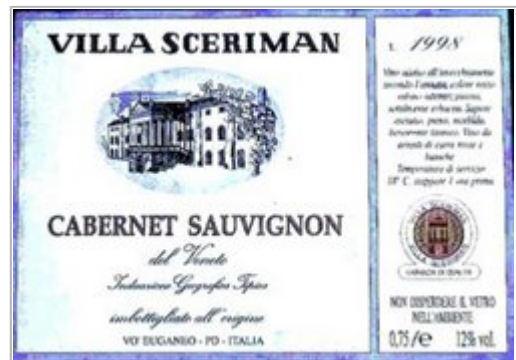
Auf Schatzsuche in der Villa Sceriman

Wir verlassen Montegrotto Richtung Villa Draghi, stoßen auf den Radweg E20 und fahren über Abbazia di Praglia (heiliges Wasser tanken) nach Trepointi (evtl. Kaffeepause in der Bar Montebello).