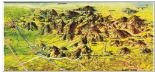
Die Euganäischen Hügel rund um Montegrotto

Über den Corso delle Terme geht es Richtung Abano, Wir durchqueren diesen mondänen und glitzernden Kurort über die Fußgängerzone und erfreuen uns rechts und links an den Auslagen der hochkarätigen Juwelier-, Leder- und Souvenirgeschäfte.